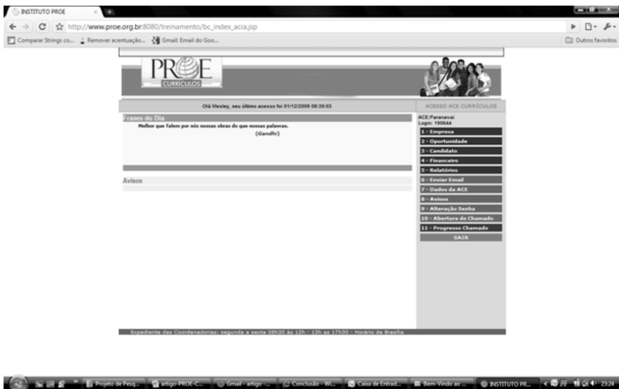
Figura IV – Tela de acesso do perfil operador

Na figura IV, é possível observar o perfil do operador. Neste perfil o usuário tem as seguintes funções no menu: