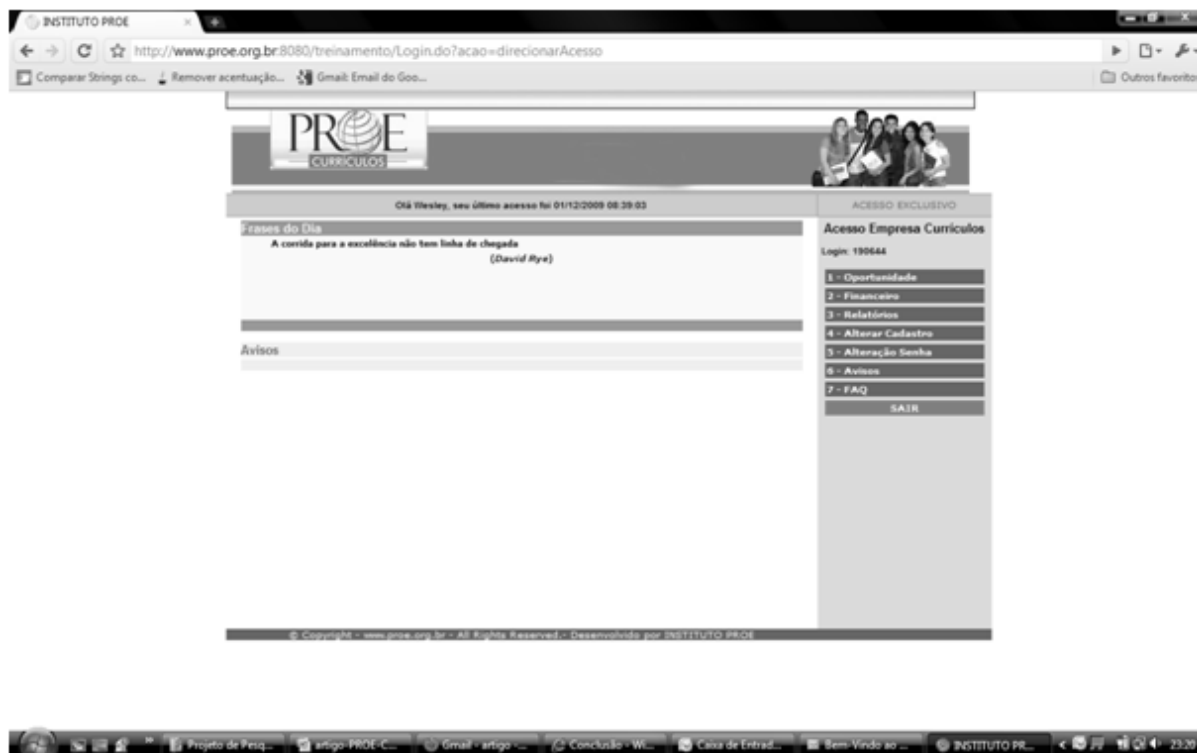
Figura II – Tela de acesso perfil empresa

A interface é responsável por uma parte essencial do sistema, a parte visível para o usuário da qual o mesmo realiza tarefas almeçadas. Conforme referido no tópico desenvolvimento o sistema consiste em quatro perfis: candidatos, empresas, operadores e máster.