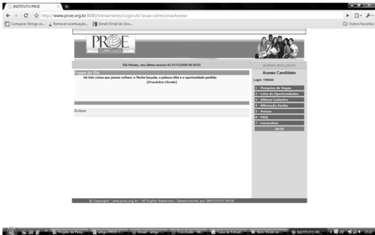
Figura III – Tela de acesso do perfil candidato

Na figura III, é possível observar o perfil do candidato. Neste perfil o usuário tem as seguintes funções no menu: